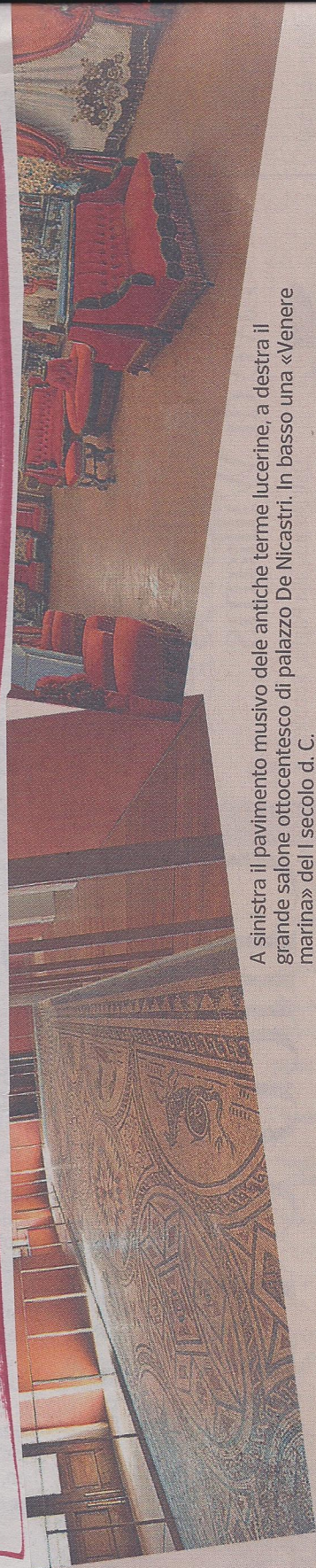
A sinistra il pavimento musivo delle antiche terme lucerine, a destra il grande salone ottocentesco di palazzo De Nicastri. In basso una «Venere marina» del I secolo d. C.

«Narrazioni dalla terra per la terra. Piccole e grandi migrazioni, di ieri e di oggi» è il titolo 2013 della Summer school che EspérO, azienda spin-off dell'Università del Salento organizza a Carpignano Salentino, un luogo simbolicamente pregno di significati. Lì, infatti, nel 1974 fu inaugurata una pratica di «baratto culturale», grazie ad Eugenio Barba e al suo Odin Teatret che nel piccolo centro griko realizzò un suo spettacolo in un processo di scambio con la popolazione locale. L'edizione 2013 affronta il tema della terra e della relazione che gli uomini stabiliscono con essa, e quello della migrazione, per promuovere un «baratto culturale» che percorra la via della lotta alle discriminazioni, dell'accoglienza e dell'integrazione